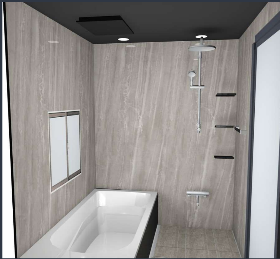
画像はイメージです。