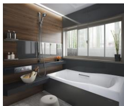
▲プレデンシア プレミアム