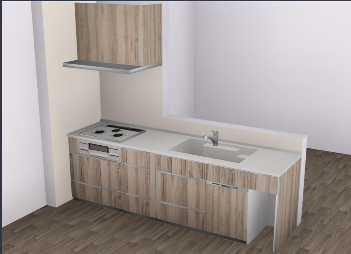
画像はイメージです。