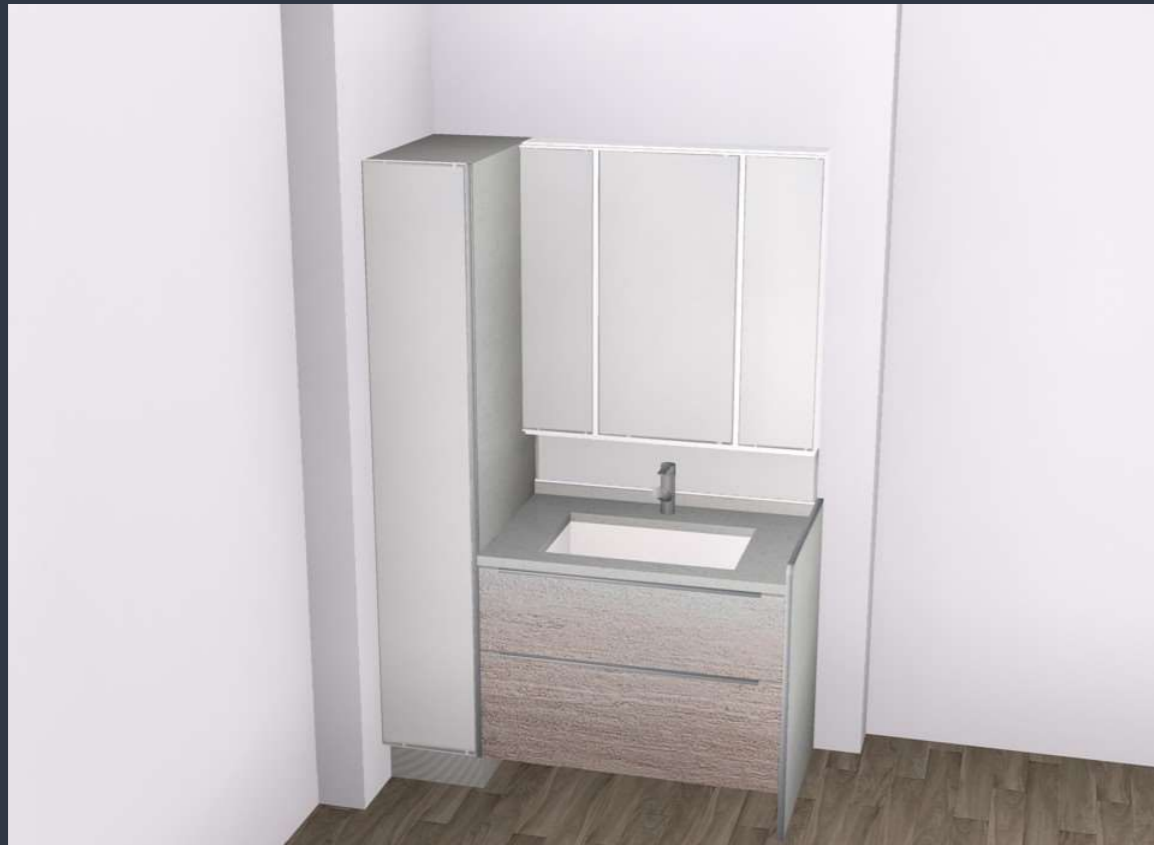
画像はイメージです。