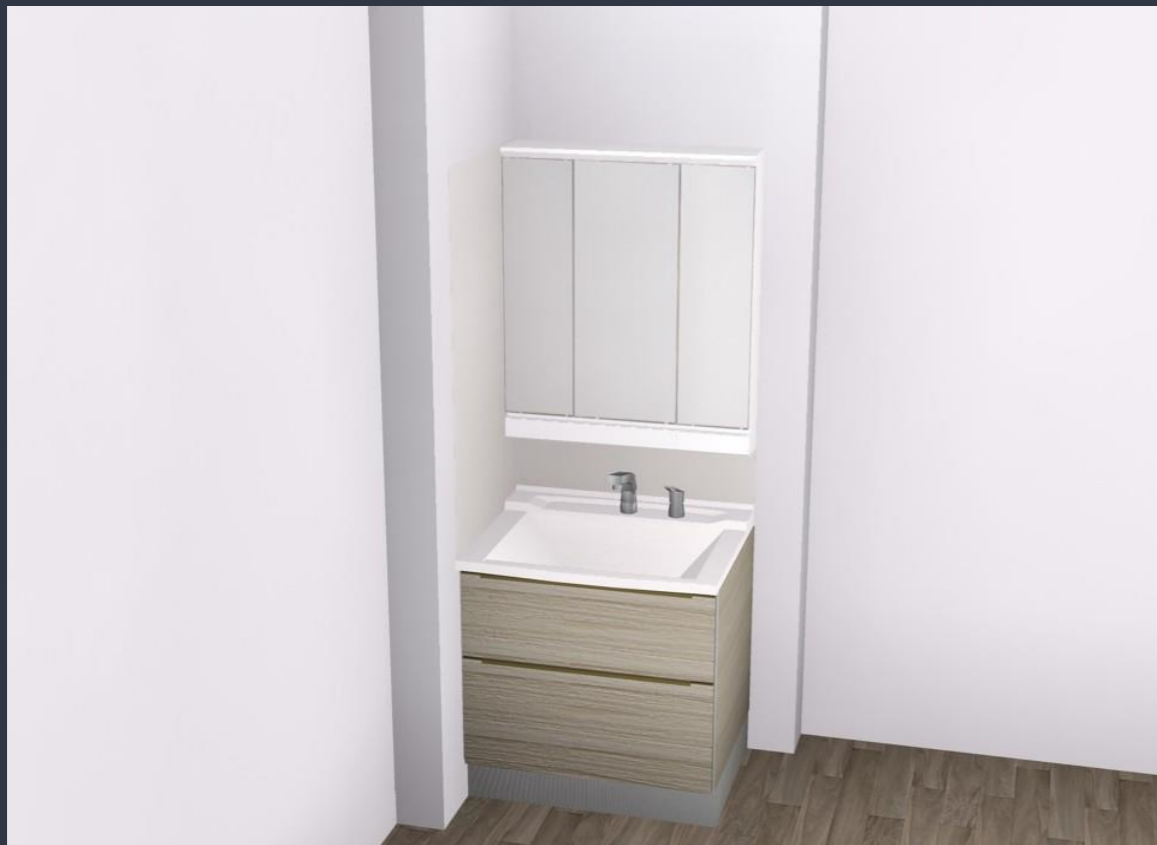
画像はイメージです。