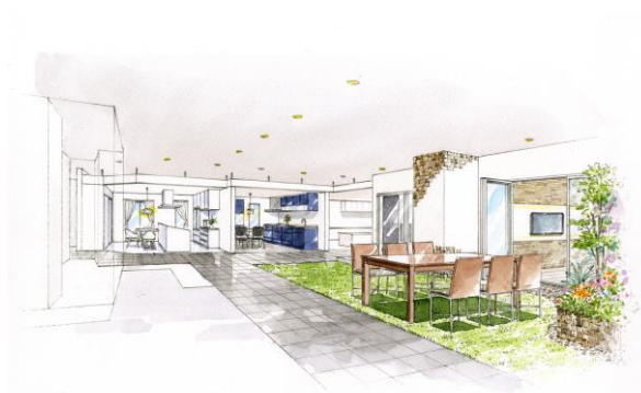
春日部ショールーム（埼玉県）