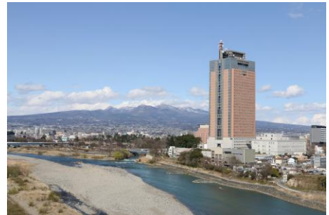
ホーローアート (群馬県庁 利根川 赤城山)

『リフォーム提案コーナー』も設け、コンロやレンジフードの交換から、キッチン全体のリフォーム提案、『ぴったりサイズシステムバス』展示コーナーを用いた浴室リフォームの提案が可能です。