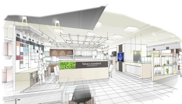
前橋ショールーム（群馬県）