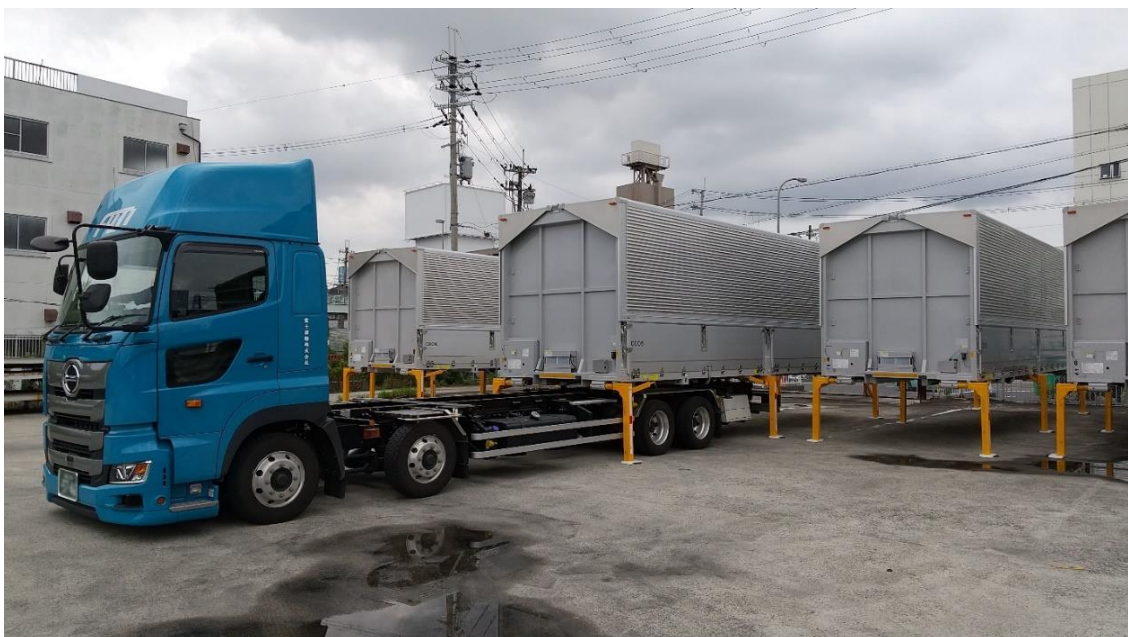
スワップボディコンテナの交換の様子