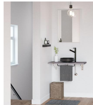
(2 階廊下に設置された ＜エッジタイプ＞)

また、家の顔とも言われる玄関をはじめ、廊下や寝室など場所を選ばずインテリアにマッチするミニマルでスタイリッシュなデザインも特徴の一つ。「花器」をイメージしたホーロー製ボウルは、落ち着いたマットブラック調で、力強さを感じさせる「エッジタイプ」と、柔らかな印象の「ラウンドタイプ」の 2 種類からお選びいただけます。限られた空間に納まるコンパクトな奥行ながらも、キャビネット収納タイプも選択可能です。ホワイトや木目調など 4 種類の扉デザインをご用意しており、すっきりとした見た目でお手入れ性もよいプッシュオープン扉を採用しています。