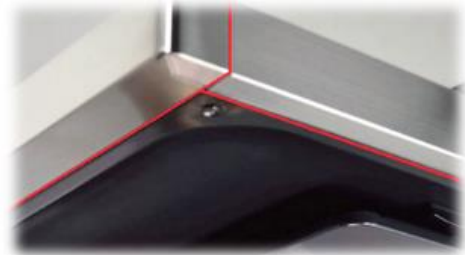
(左：新たに採用したシームレス構造／ 右：従来構造)