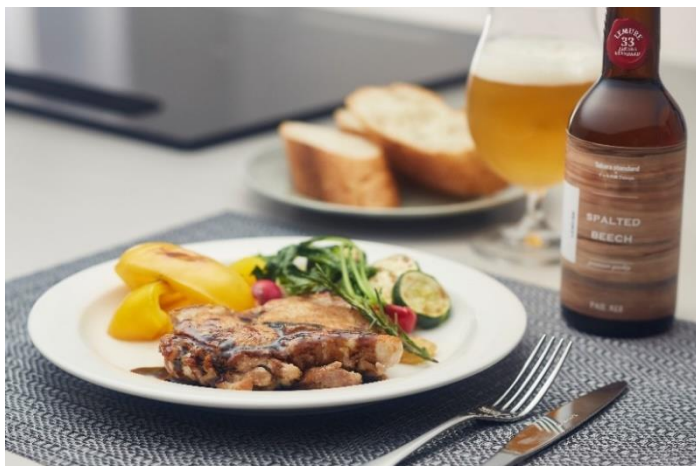
新柄「スポルテッドビーチ」からインスピレーションを受けた「チキンのハーブ焼き バレサミソース仕立て」、オリジナルクラフトビール