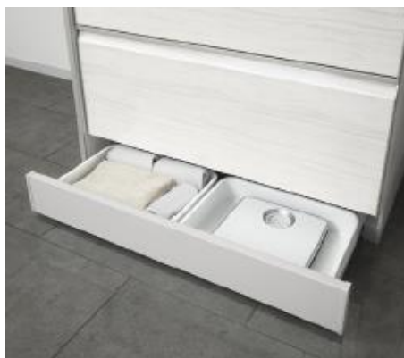
「そこまでホーローラックタイプ」