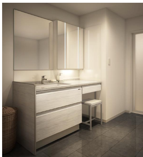
【本体間口 150 cmプランイメージ】