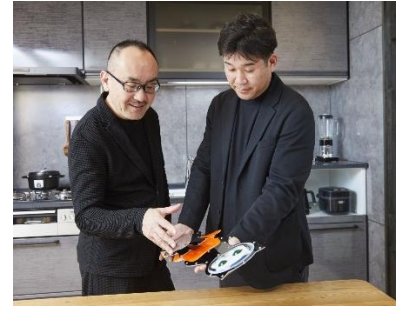
(試作品確認の様子)

今回の取り組みにあたってタカラスタンダード独自の「高品位ホーロー」に触れていただき、アート作品の素材としての可能性も感じていただいた結果、本製品の開発と発売が実現しました。