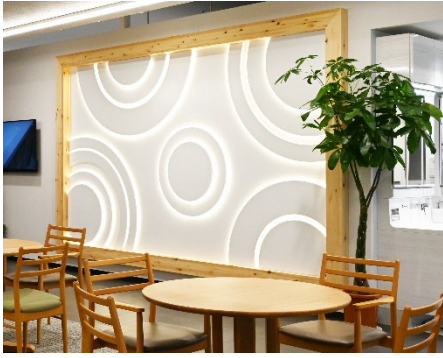
(電飾造作を組み合わせた事例)

さらに、従来の「エマウォール インテリアタイプ」では、直線的な切断に特化したシャーリングという方法で切断するため、形状が長方形や正方形といった矩形に限られていました。今回新発売の「レーザーカットパネル W」、「レーザーカットパネル S」では、先述のレーザービームによる切断を用いる事により、多角形や円形に加え、自由曲線状にカットすることができるようになりました。異素材や電飾造作と組み合わせられたり、異なる柄のパネル同士で幾何学模様をデザインできたりと、表現力が大きく向上しました。