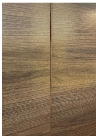
(見切り材による仕上げ)

そしてこの度、さらにデザイン性が向上した2タイプを新発売しました。従来の製品では、複数枚のパネルを貼る際、プラスチックやアルミ製の見切り材でパネル端部に蓋をする必要がありました。今回発売する「レーザーカットパネル W」と「レーザーカットパネル S」は、パネルの端部をレーザービームでカット。シャープに仕上げることで見切り材が不要となり、パネル間の隙間を空けた目透かし貼りでも上品な表現にすることができます。さらに「レーザーカットパネル W」では、パネル同士を突き合わせて施工する突き付け貼りも選ぶことができ、シームレスで1枚絵のようなダイナミックな表現が可能です。