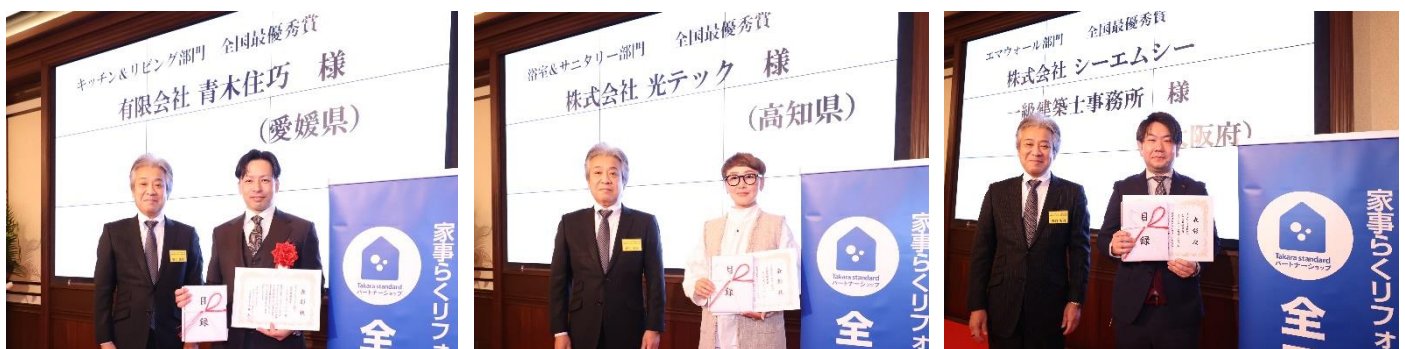
(全国最優秀賞受賞者の皆さま)