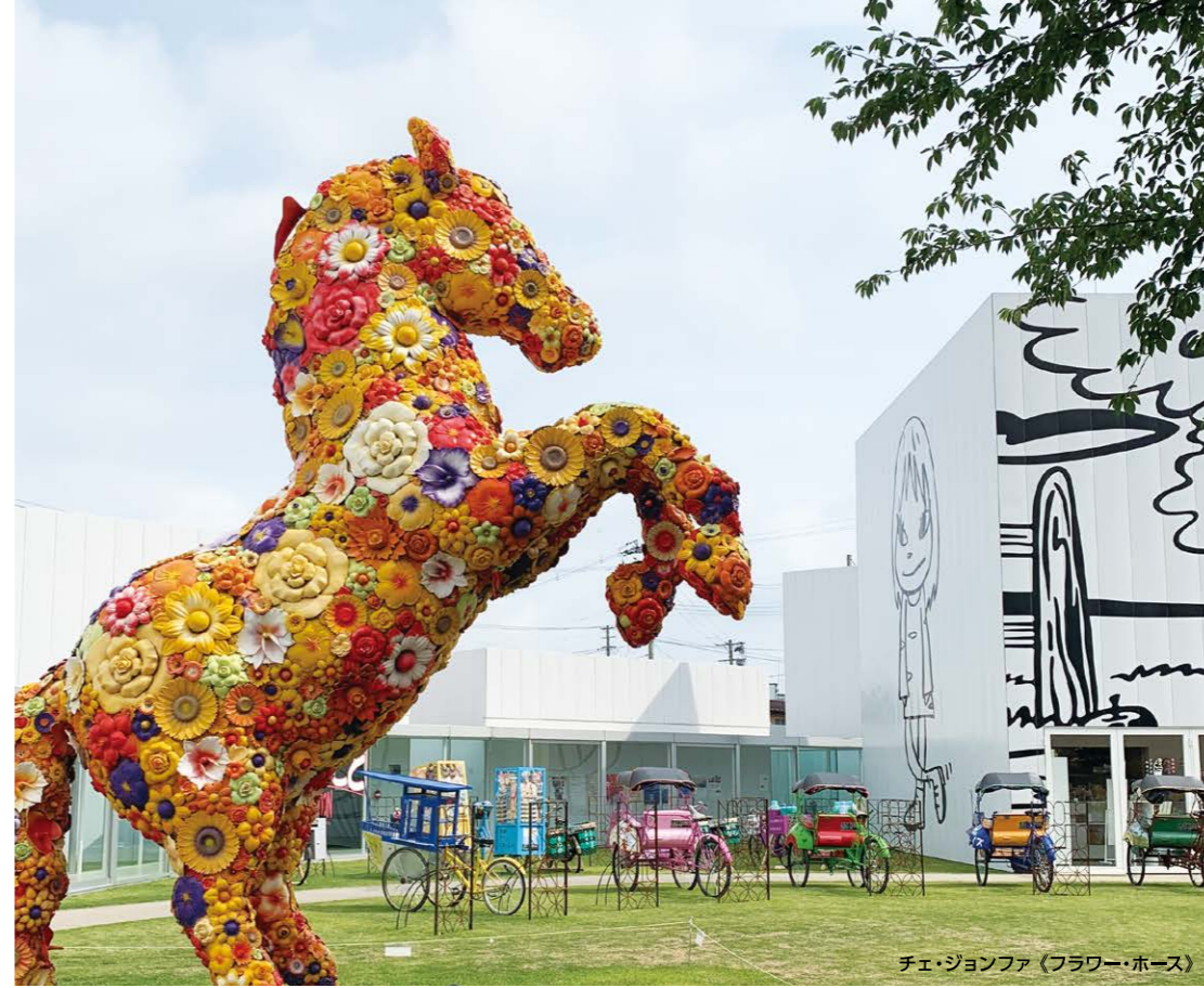
チェ・ジョンファ《フラワー・ホース》

十和田市現代美術館 十和田から最新のアートを発信する“美術館”。各国の現代アートを展示し、シンボリックな作品「フラワー・ホース」が入口で迎えてくれます。