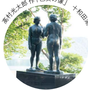
高村光太郎作「乙女の像」 十和田湖畔