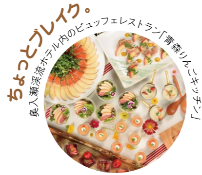
ちよつとプレイク。 奥入瀬溪流ホテル内のビュッフェレストラン「青森りんごキッチン」