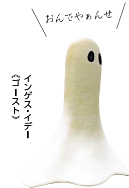
インゲス・イデー 《ゴースト》

奥入瀬溪流は側に車道と遊歩道が整備されており、体力に応じて散策できるのも大きな魅力。大自然に触れて心が癒やされたら、十和田市現代美術館へ。1室に1作品という贅沢な空間にユニークな現代アートを展示し、鑑賞するというより体感するアートが堪能できます。さらに三沢市へと足をのばせば、昭和の異端児・寺山修司の記念館が。扉を開けるとそこは異世界。テラヤマ・ワールドの迷宮に入り込んでみましょう。 自然とアート、カルチャー。それぞれが独自の個性を輝かせているこの街は、心を捉えて離さない魅力で旅心を満足させ、訪れた人を笑顔にしてくれます。