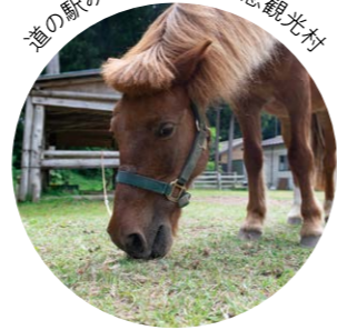
道の駅みさわ斗南藩記念観光村