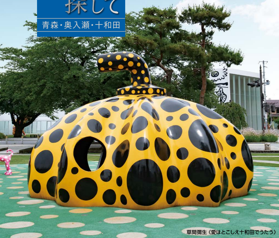
草間彌生《愛はとこしえ十和田でうたう》