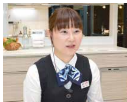
予約をされていないお客様も、アドバイザーが対応します。