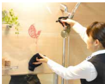
展示されている実製品を使って、ホーローの品質や魅力を紹介。

ゆとりを持たせた空間にテーマを設定した展示を行うなど、タカラスタンダードの魅力をしっかりとご確認いただけます。