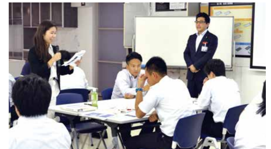
グループでのディスカッションやプレゼンテーションも実施。