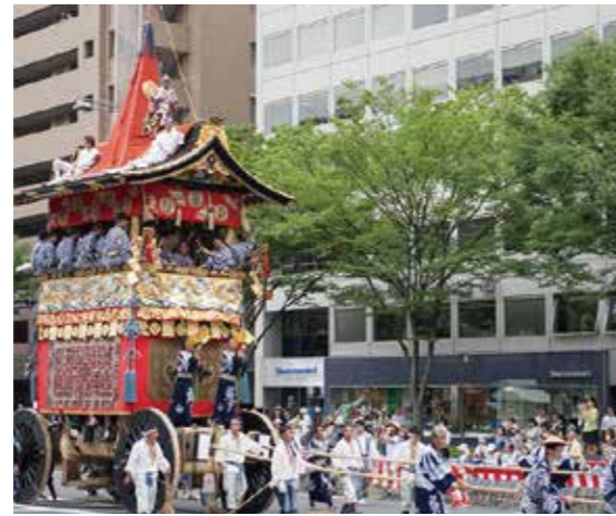
京都御池ショールームの前を、祇園祭の山鉾が通ります。

京都御池ショールームでは、地元とのつながりを大切に日本三大祭りに 数えられる祇園祭の山鉾の一つ、岩戸山の駒形提灯で参加しています。 祭のハイライトである山鉾巡行では、ショールームを通る際に厄除け祈願 をした粽(ちまき)を岩戸山からいただいています。