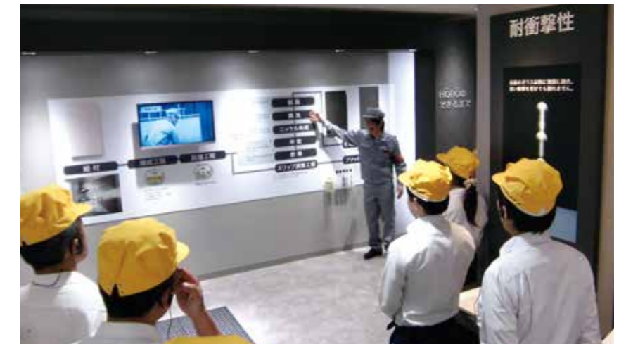
福岡工場ではリフォームに活きるホーロー製品の様々な品質を、より細かく学びます。