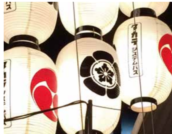
宵間に揺れる駒形提灯は、とても風情があり幻想的。