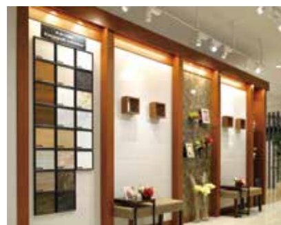
暮らしのイメージをふくらませる展示内容。

お客様は、ひと月に平均2500組。大阪府下だけではなく、兵庫県や奈良県などからもたくさんの方がいらっしゃ