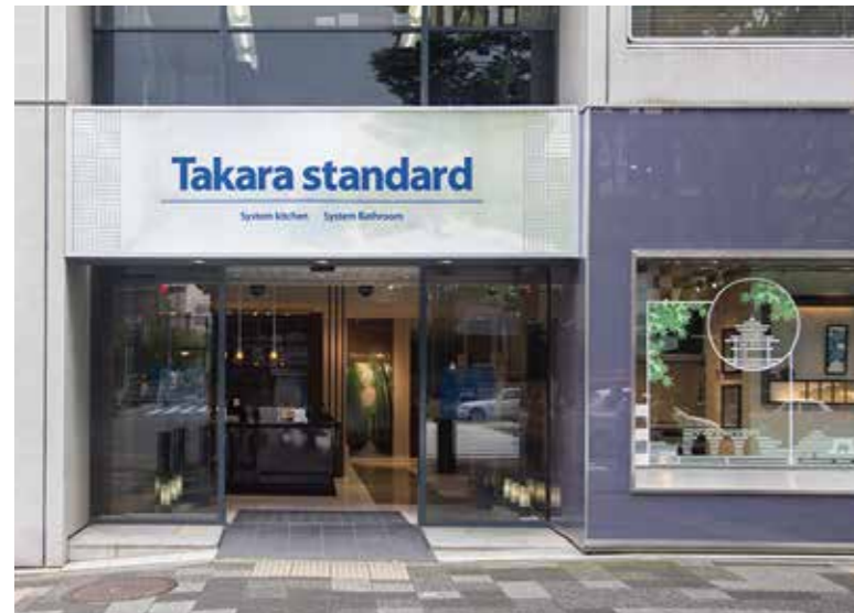
祇園祭のメイン通に面した京都御池ショールーム。