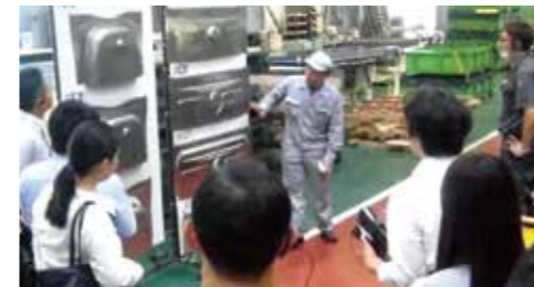
三島工場ではステンレス板の加工を見学。

ホーロー製品の製造工程の説明から、高品位ホーローの特長、リフォームへの対応力などを学習。製品の本質の価値を理解することで提案型の営業スタイルを身につけ、お客様からの信頼の獲得を目指します。