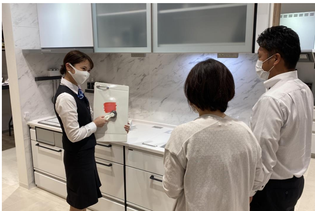
(ショールームでの接客風景)

システムキッチン・バスを中心とした住宅設備機器メーカー・タカラスタンダード株式会社(本社：大阪市城東区、代表取締役社長：渡辺岳夫)は、リフォーム需要喚起策の一環として、見積もりや成約をしていただいたユーザーさまを対象とした「新しい生活応援 W キャンペーン」を2020年9月1日(火)より開始します。