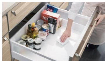
ホーローキャビネットでお手入れ簡単