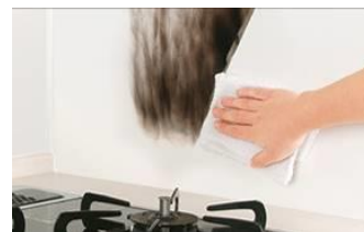
熱やキズ・衝撃にも強い