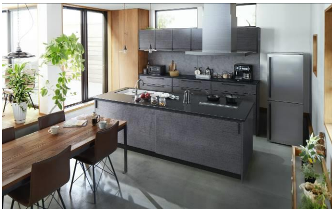
トレンドのダークカラーを取り入れたキッチン

システムキッチン・バスを中心とした住宅設備機器メーカー・タカラスタンダード株式会社（本社：大阪市城東区、代表取締役社長：渡辺岳夫）は、世界で初めてホーロー流し台の販売を開始した1967年から長年にわたり当社の主力商品であるホーローキッチンの新ブランド「トレーシア」を2020年2月25日（火）に全国約170カ所のショールームで発売します。