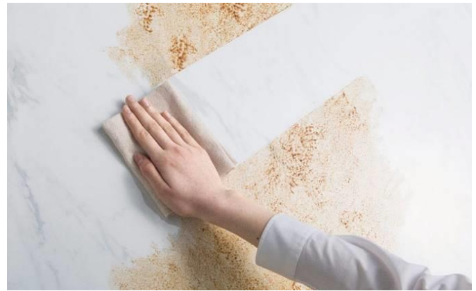
汚れが染み込まない、らくらくお手入れの高品位ホーロー

「トレーシア」は、使う人にとって長く愛せる「たからもの (treasure)」のようなキッチンになってほしいという想いから命名した、共働き世帯を始め幅広い世代のニーズに応えるホーローシステムキッチンです。従来の中級価格帯シリーズを一新し、新しいプランやリフォーム対応力を備えて誕生しました。