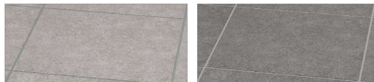
カームグレー カームダークグレー