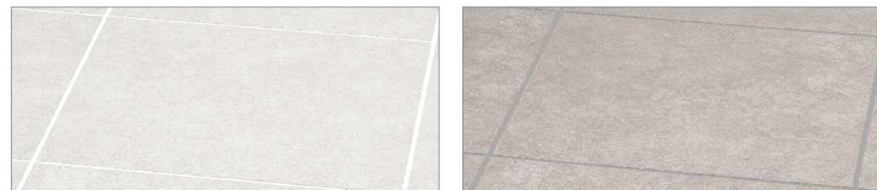
カームホワイト カームベージュ