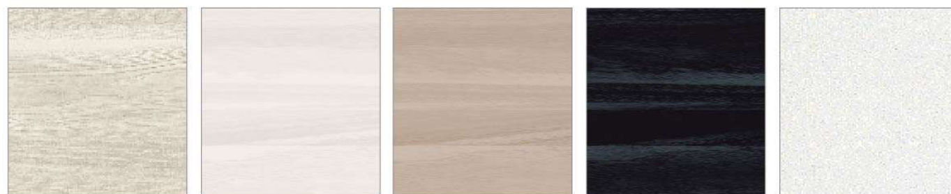
ホワイトアッシュ ウォルナットホワイト ウォルナットグレー ウォルナットブラック パールホワイト