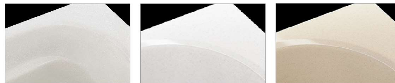
クリスタルパールホワイト シュガーライトグレー シュガーライトベージュ