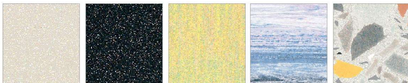
パールベージュ パールブラック キャンバスイエロー カリビアンブルー コラージュミックス