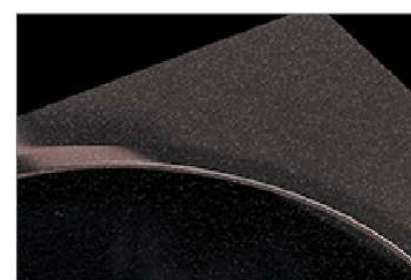
シュガーブラック