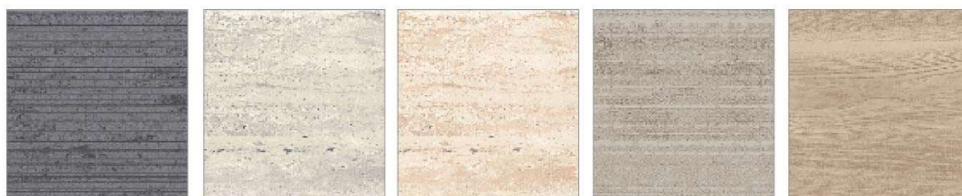
コンクリートグレー フロウストーングレー フロウストーンテラコッタ スタッコグレー グレージュアッシュ