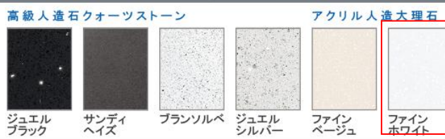
高級人造石クォーツストーン、ジュエルブラック、サンディヘイズ、ブランソルベ、ジュエルシルバー、ファインベージュ、パネル選択なし、ファインホワイト