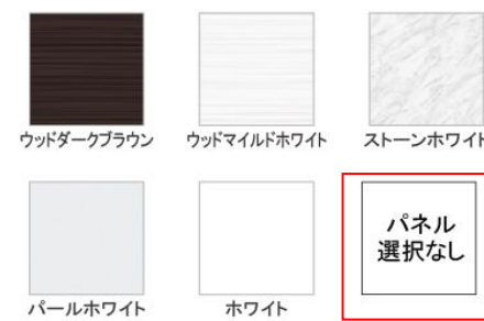
ウッドダークブラウン、ウッドマイルドホワイト、ストーンホワイト、パールホワイト、ホワイト

※ウッドダークブラウン・ウッドマイルドホワイト・ストーンホワイトは＋¥1,400（税抜き）となります。