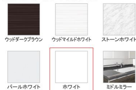
ウッドダークブラウン、ウッドマイルドホワイト、ストーンホワイト、パールホワイト、ホワイト、ミドルミラー

※フラットカウンタータイプのみ対応します。 ※ミドルミラーは一部ミラーに対応しません。