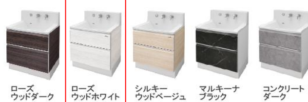
ローズウッドダーク、ローズウッドホワイト、シルキーウッドベージュ、マルキーナブラック、コンクリートダーク