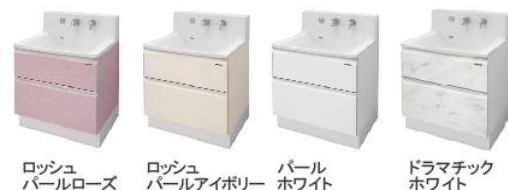
ロッシュパールローズ、ロッシュパールアイボリー、パールホワイト、ドラマチックホワイト