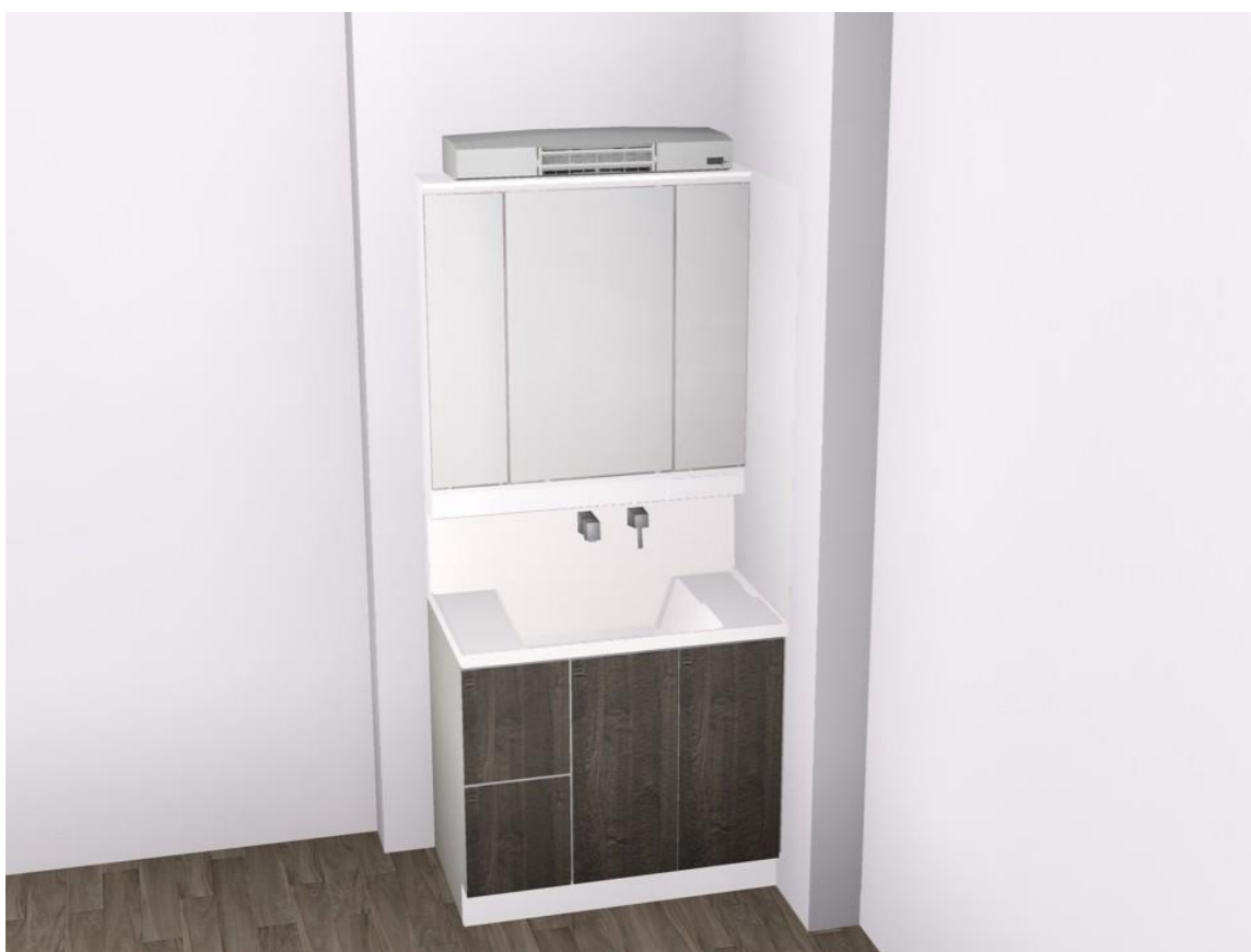
画像はイメージです。