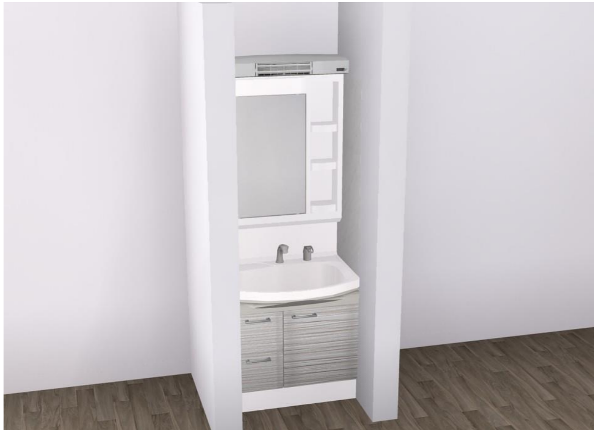
画像はイメージです。