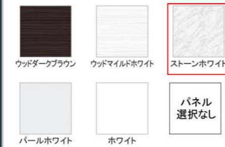
ウッドダークブラウン ウッドマイルドホワイト ストーンホワイト パールホワイト ホワイト パネル選択なし

※ウッドダークブラウン・ウッドマイルドホワイト・ストーンホワイトは+¥1,400（税抜き）となります。