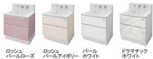
ロッシュパールローズ ロッシュパールアイボリー パールホワイト ドラマチックホワイト