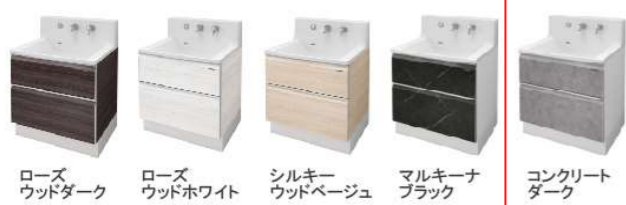
ローズウッドダーク ローズウッドホワイト シルキーウッドベージュ マルキーナブラック コンクリートダーク