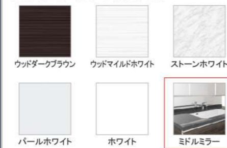
ウッドダークブラウン ウッドマイルドホワイト ストーンホワイト パールホワイト ホワイト ミドルミラー

※フラットカウンタータイプのみ対応します。 ※ミドルミラーは一部ミラーに対応しません。