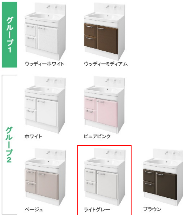
※写真はハイバックタイプです。