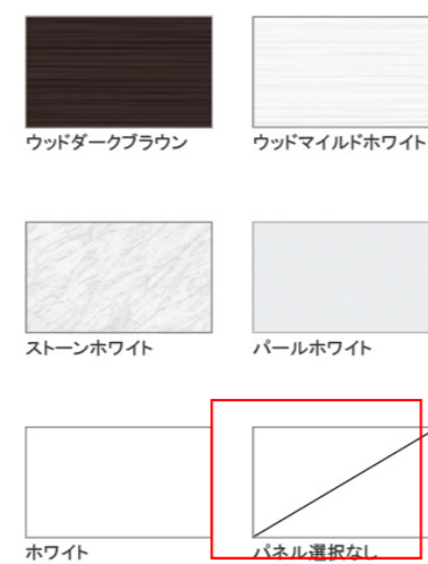
※ウッドダークブラウン・ウッドマイルドホワイト・ストーンホワイトは+¥1,400 (税抜き) となります。