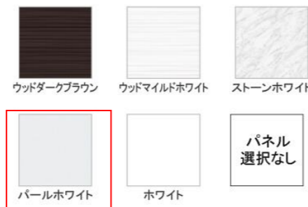
ウッドダークブラウン ウッドマイルドホワイト ストーンホワイト パールホワイト ホワイト

※ウッドダークブラウン・ウッドマイルドホワイト・ストーンホワイトは+¥1,400 (税抜き) となります。