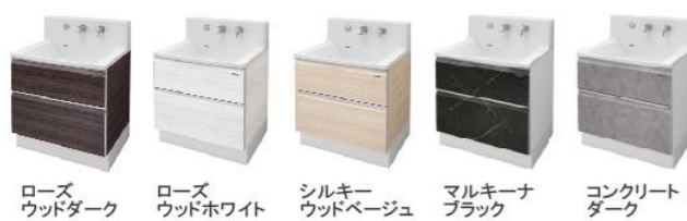
ローズウッドダーク ローズウッドホワイト シルキーウッドベージュ マルキーナブラック コンクリートダーク