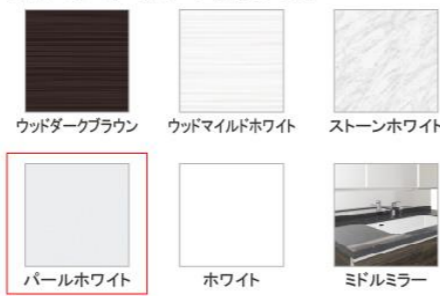
ウッドダークブラウン ウッドマイルドホワイト ストーンホワイト パールホワイト ホワイト ミドルミラー

※フラットカウンタータイプのみ対応します。 ※ミドルミラーは一部ミラーに対応しません。