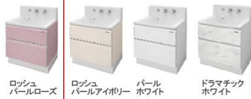
ロッシュパールローズ ロッシュパールアイボリー パールホワイト ドラマチックホワイト