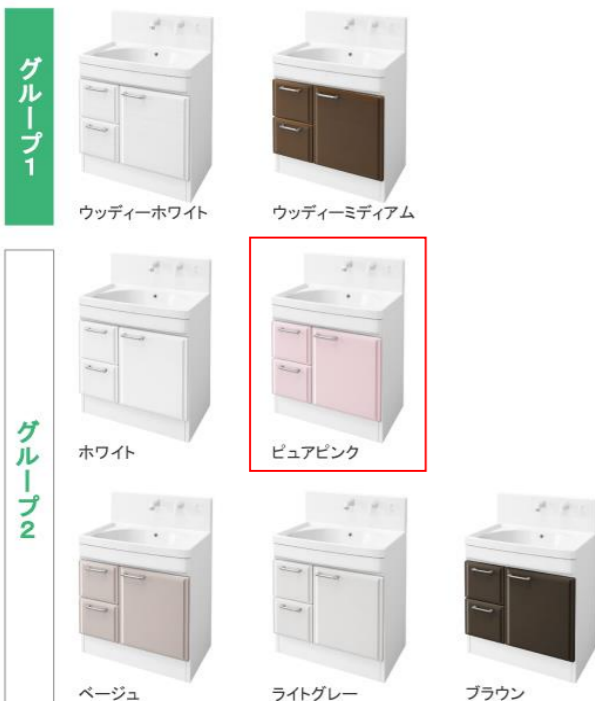
※写真はハイバックタイプです。