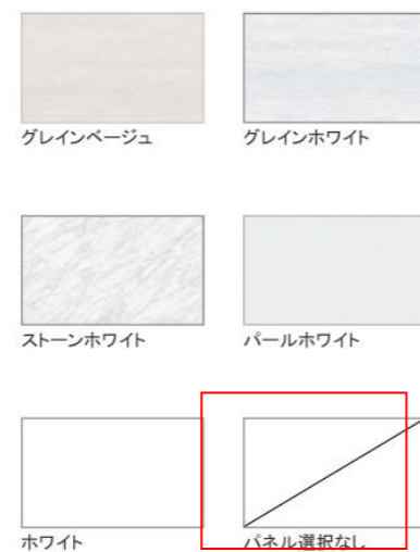
※グレインベージュ・グレインホワイト・ストーンホワイトは+¥1,400 (税抜き) となります。