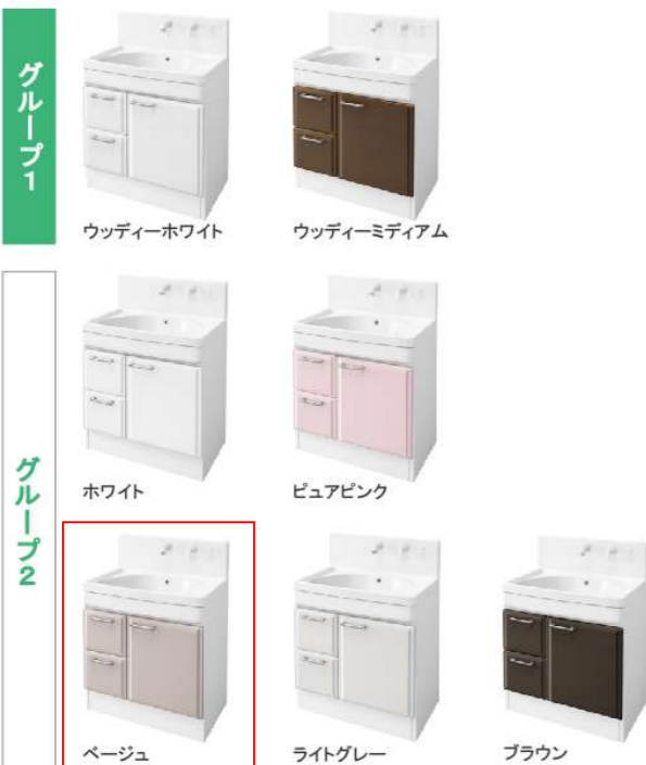
※写真はハイバックタイプです。