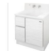
ミックスウッドホワイト