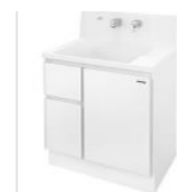
パールアイボリー