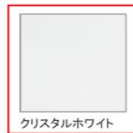
クリスタルホワイト