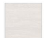
グレインベージュ