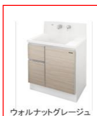
ウォールナットグレイジュ