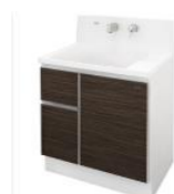
ミックスウッドダーク