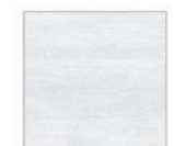
グレインホワイト