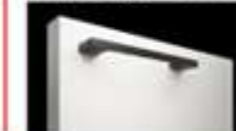
ハンドル引手:ブラック