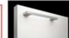
ハンドル引手:シルバー