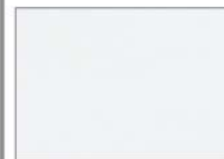
クリスタルホワイト