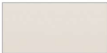
フローラルアイボリー