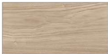
グレイジュアッシュ