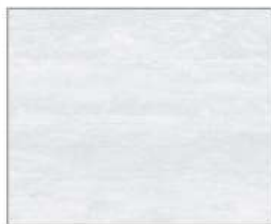
グレインホワイト