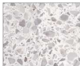
ピアンコテラゾー