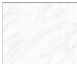
ストーンホワイト