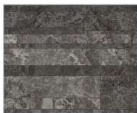
ルナダークグレー