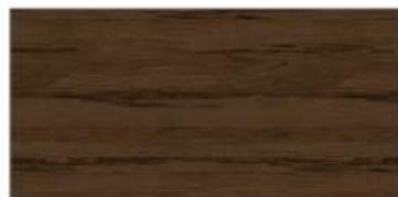
チェスナットミディアム