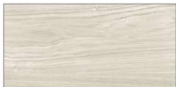
ホホワイトアッシュ