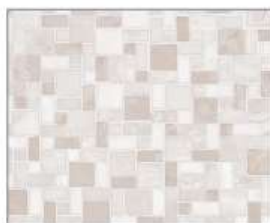
ミルキーモザイク