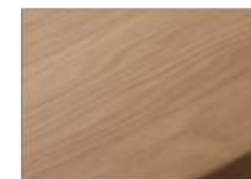
ヒッコリーナチュラル