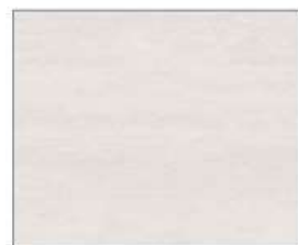
グレインベージュ