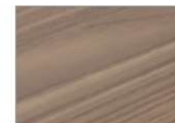
スモーキーエルム